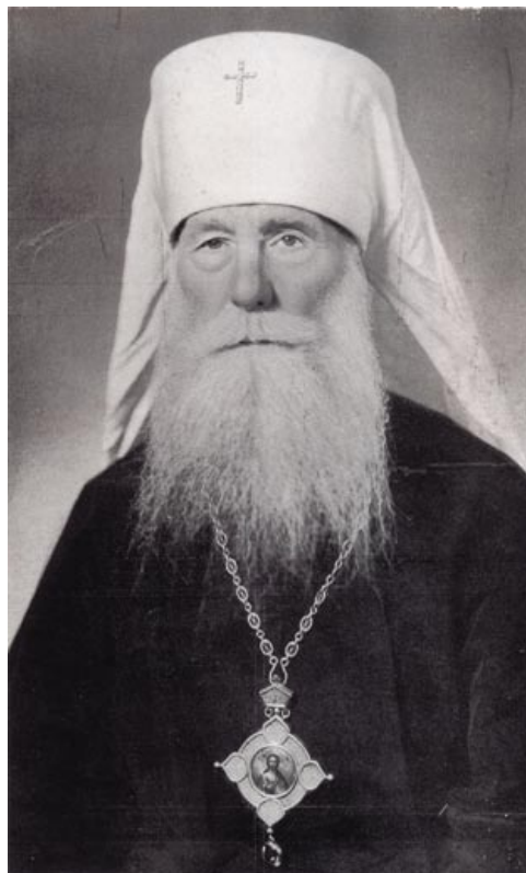
Митрополит Минский и Белорусский Пантелеимон (Рожновский), Предстоятель Белорусской митрополии (1942–1946). Фото сер. 1940-х годов

Прямым следствием антисоветской настроенности белорусских иерархов стала поддержка белорусских и российских коллаборационистских формирований, включенных в структуры вермахта и СС. В октябре 1944 года бывший епископ Витебский и Полоцкий Афанасий (Мартос) получил от немецкого военного командования предложение возглавить русских и украинских капелланов вермахта в звании генерала. Сославшись на возможное неприятие белорусского архиерея русскими и украинскими священниками, епископ Афанасий ответил отказом. Узнав о произошедшем, бывший митрополит Минский и Белорусский Пантелеимон (Рожновский) крайне неодобрительно оценил этот поступок, заявив епископу Афанасию: «Вы не смели отказываться. Ваш долг защищать родину» [3, с. 93–94]. Поскольку Предстоятель Белорусской митрополии имел устоявшуюся репутацию иерарха пророссийских убеждений,