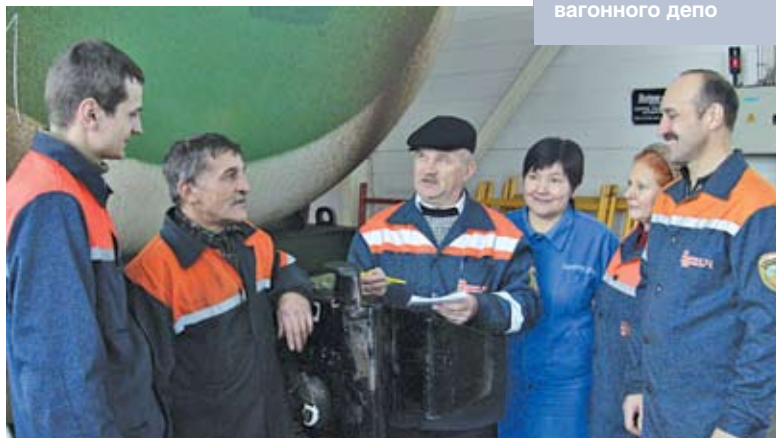
Работники малярного цеха Витебского вагонного депо

Техника есть техника, и без надлежащего ухода долго не протянет, особенно это важно там, где от нее зависит безопасность людей. По этой причине на железной дороге ремонт подвижного состава ведется строго по плану и никаких отклонений быть не может. При этом организация ремонта вагонов в депо основана на новейших достижениях зарубежного и отечественного опыта и обеспечивает высокое качество ремонтных работ цистерн для перевозки нефтепродуктов, сжиженных газов, химических продуктов, цистерн-цементовозов. Ремонтные цеха оснащены всем необходимым комплексом высокопроизводительного технологического и диагностического оборудования. По программе импортозамещения на предприятии освоено производство пылеулавливающих сеточек, запасных резервуаров, сигнальных дисков, резинотехнических изделий для