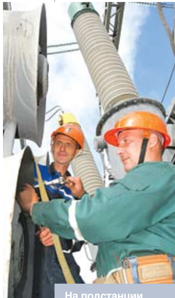
На подстанции «Витебская» РУП «Витебскэнерго»

Средства на это пойдут немалые, но все со временем окупится. Понятно, что в свете Программы социально-экономического развития на ближайшую пятилетку и ситуации в экономике без обновления и модернизации ни одно предприятие не имеет будущего. Кроме замены турбин, планируем внедрить схему оборотного водоснабжения, что позволит снизить затраты на воду, а также исключить забор и сброс воды в реку Западная Двина. До 2015 года нами планируется установить газовую турбину мощностью 70 МВт и котел-утилизатор, а это даст возможность, сжигая газ, сразу получать и электроэнергию, и пар. И конечно, все достижения, которые позволили ТЭЦ два года назад стать лучшим предприятием в системе ГПО «Белэнерго», – результат труда наших людей – ответственных, дисциплинированных, настоящих профессионалов.