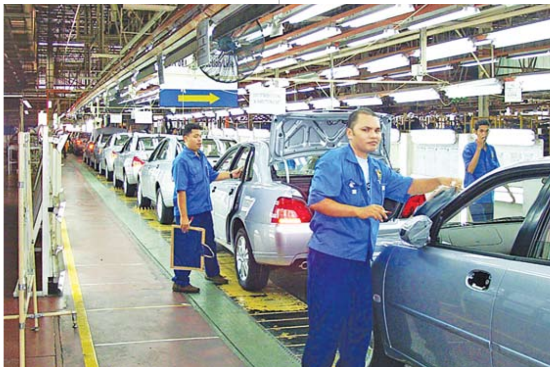
Сборка автомобилей на одном из заводов корпорации «Протон Холдингс»

Финансовый кризис 1997–1998 годов серьезно пошатнул финансовую систему страны и обрушил ее валюту – ринггит. Затронул страну и спад мировой экономики в 1999–2001 годах, тяжело отразившийся на ее основных торговых партнерах – США, Японии, Сингапуре. После терактов в Америке 11 сентября 2001 года многие инвесторы, озабоченные угрозой рисков, стали покидать не только опас-