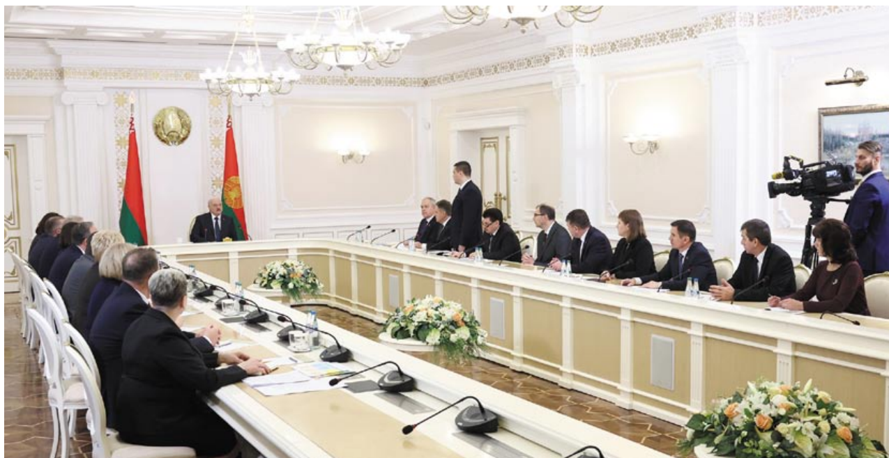
2 декабря Президент Беларуси Александр Лукашенко провел совещание по вопросам совершенствования вступительной кампании в вузы

Кроме того, выстроена этапность приема: до 12–13 июня будем принимать и зачислять ребят на целевую форму обучения и только потом на бюджетную. Это сделано, чтобы было четкое распределение между целевиками, бюджетниками и платным приемом.