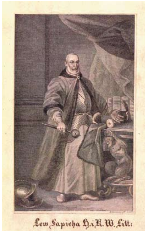
Канцлер Вялікага Княства Літоўскага Леў Сапега

твоимъ землямъ к тебе добровольне приехати и отехати безо всякого задержания и зачепки» [5, с. 120; 7, с. 140]; адным з важных менавіта для ВКЛ пунктаў было свабоднае перамяшчэнне купцоў абедзвюх краін: «А купцомъ твоимъ изо всихъ твоихъ земель