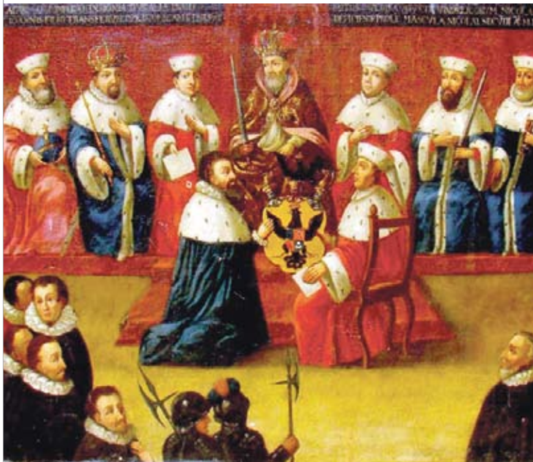
Прысваенне Мікалаю Радзівілу Чорнаму і яго спадчыннікам тытула і герба князёў Святой Рымскай імперыі. Карціна XVI стагоддзя

Відаць, гэты пратэст падзейнічаў, бо неўзабаве ў Маскву быў накіраваны ганец Рэчы Паспалітай Ян Дзевялтоўскі з датаваным 29 красавіка 1590 года лістом ад імя караля Жыгімонта III [12, с. 98]. Сутнасць гэтага дыпламатычнага дакумента зводзілася да наступнага: Рэч Паспалітая прапаноўвала Маскоўскай дзяржаве аб'яднаць ваенна-палітычныя намаганні супраць Асманскай імперыі і Крымскага ханства; выказвала жаданне заключыць вечны мір паміж дзяржавамі; для рэалізацыі гэтай важнай знешнепалітычнай праграмы кароль Жыгімонт III прасіў у маскоўскага цара Фёдара Іванавіча для сваіх паслоў «апасную грамату»