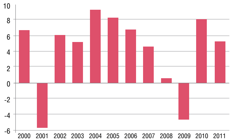
Рисунок 1. Турция: долгосрочная динамика темпов роста ВВП (2000–2011 годы), %