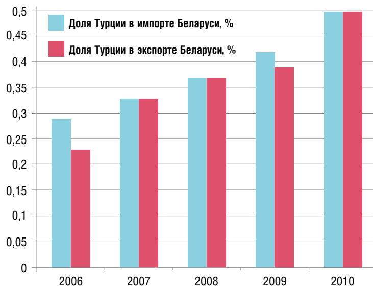
Рисунок 2. Доля Турции в импорте и экспорте Беларуси.