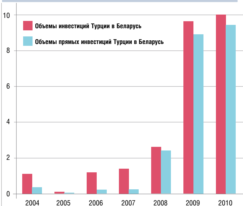
Рисунок 4. Объем инвестиций Турции в Беларусь по годам (млн долл.)