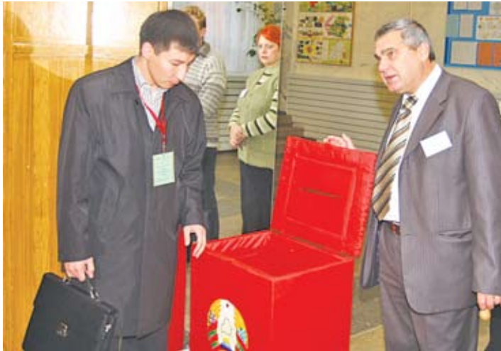
Наблюдатели от миссии СНГ на избирательном участке № 60 в Могилеве