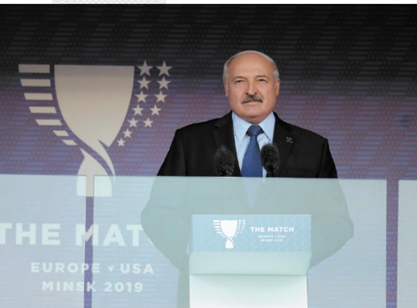
▲ Президент Беларуси Александр Лукашенко во время торжественной церемонии открытия легкоатлетического матча Европа – США

виде спорта ими завоевано 34 медали, в том числе 19 с того времени, как Беларусь стала суверенным государством. Из 212 стран, культивирующих легкую атлетику, мы находимся на 12-м месте по количеству медалей на чемпионатах мира!