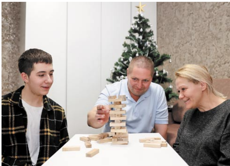
В предновогодние вечера особенно хорошо побыть дома всем вместе

– Вернулась, восстановилась в физкультурном институте. Ее много лет не отчисляли из-за призов. А специальности нет, я ее устроила на МАПИД от-