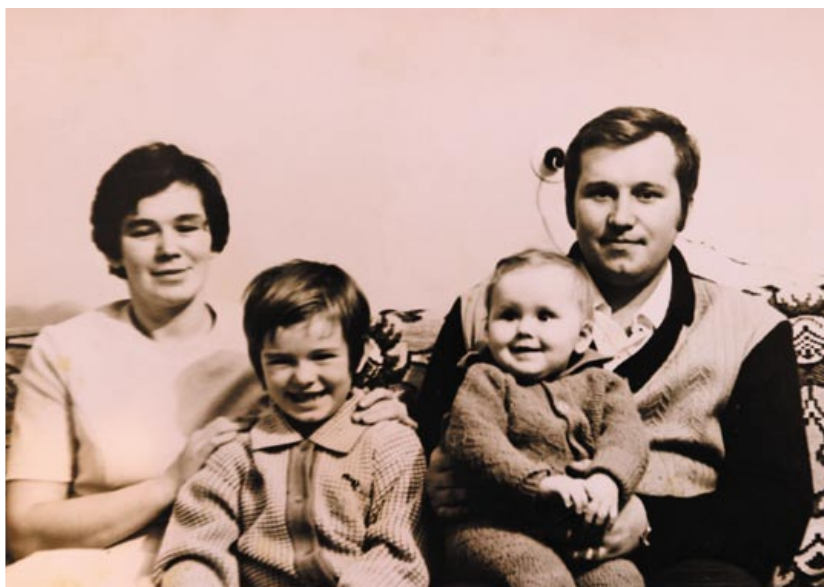
Как молоды мы были... Фото 1970-х годов

упал подъемный кран, а вскоре еще один рухнул на Одоевского. И тогда уже рентгеном стали проверять «лапы». Оказалось, в них полным-полно микротрещин от постоянной работы. Даже железо должно отдыхать.