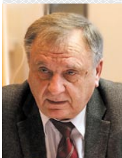
Уладзімір Рыгоравіч ШЧАСНЫ , Надзвычайны і Паўнамоцны Пасол у адстаўцы