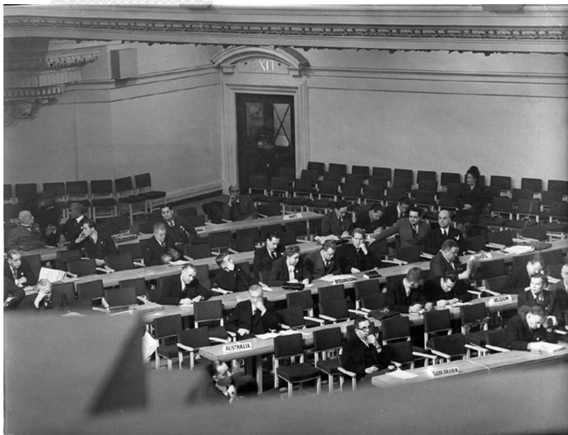
▲ У час першай сесіі Генеральнай Асамблеі ААН. Лондан, 1946 год

цыя Арганізацыі Аб'яднаных Нацый аб міжнародным заахвочванні навуковых даследаванняў у барацьбе з ракавымі захворваннямі. Адным з канкрэтных вынікаў ухвалення гэтага дакумента стала будаўніцтва першага ў Беларусі медыцынскага анкалагічнага цэнтра. Тут вялікую ролю Кісялёва, як урача і навукоўца, нельга не адзначыць. І такіх прыкладаў шмат. Таму, вяртаючыся да аднаго з папярэдніх пытанняў, зазначу: гаварыць, што беларускія дыпламаты рухаліся абсалютна ў фарватары агульна-саюзнай дыпламатыі, не варта.