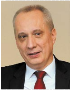
Андрэй Вадзімавіч ДАПКЮНАС , намеснік міністра замежных спраў Рэспублікі Беларусь