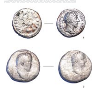
▲ Рымскія манеты з раскопак археалагічнага комплексу Кардон