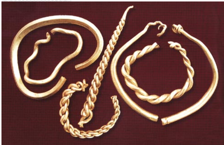
▼ Полацкі скарб