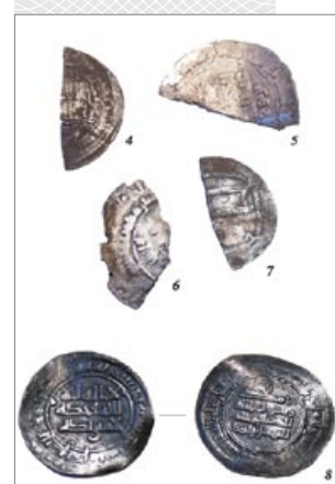
▲ Нумізматычны матэрыял VIII–X стагоддзяў з раскопак археалагічнага комплексу Кардон: 1 – Афганістан; 2, 3 – Візантыя; 4–7 – Арабскі халіфат; 8 – Волжская Булгарыя