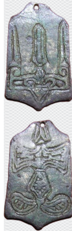
▲ Падвеска з княжацкім знакам Уладзіміра Святаславіча XI стагоддзя: пярэдні бок, адваротны бок (бронза, залачэнне): Полацк, раскопкі 2012 года. Запалоцкі пасад

А вось іншы прыклад. Мы часта кажам – XVIII стагоддзе было часам