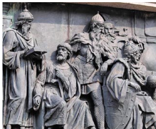
Ярослав Мудрый, Владимир Мономах, литовские князья Гедимин и Ольгерд на барельефе памятника 1000-летию Руси

Значение Русской Правды как источника доминирующих представлений о справедливости в Киевской Руси объясняется тем, что она содержит важные сведения о политическом и общественном устройстве, социальной структуре и жизненном укладе древнерусского общества. В комплексе документов Русской Правды получила выражение общая политика Киевской Руси, в том числе отношение государственной власти к общественным событиям и явлениям, находящимся в сфере внимания законодателя, в результате которых артикулировались представления о несправедливости.