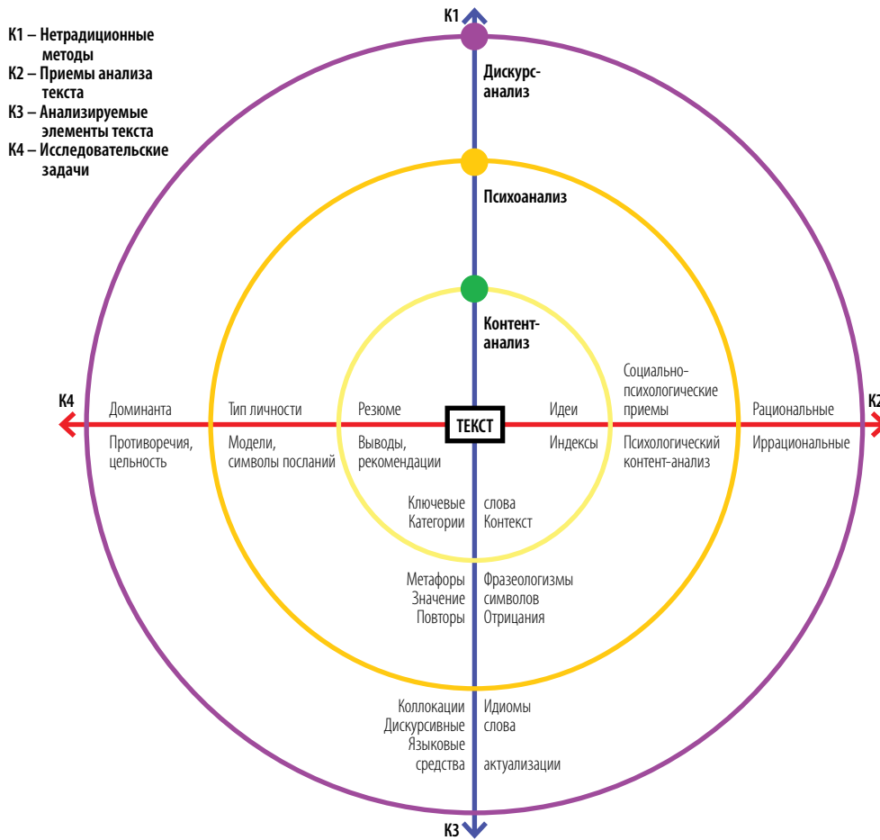
Рисунок 2. Модель сочетаемости нетрадиционных методов анализа текста нарративного источника

На деле же предполагается знакомство с картотекой полезных изданий: монографий и статей, газет и других СМИ, мемуарных источников в библиотеках, архивных фондах, личных архивах и др. Полученная информация необходима для создания затем полноценной источниковой базы и определения цели исследования.