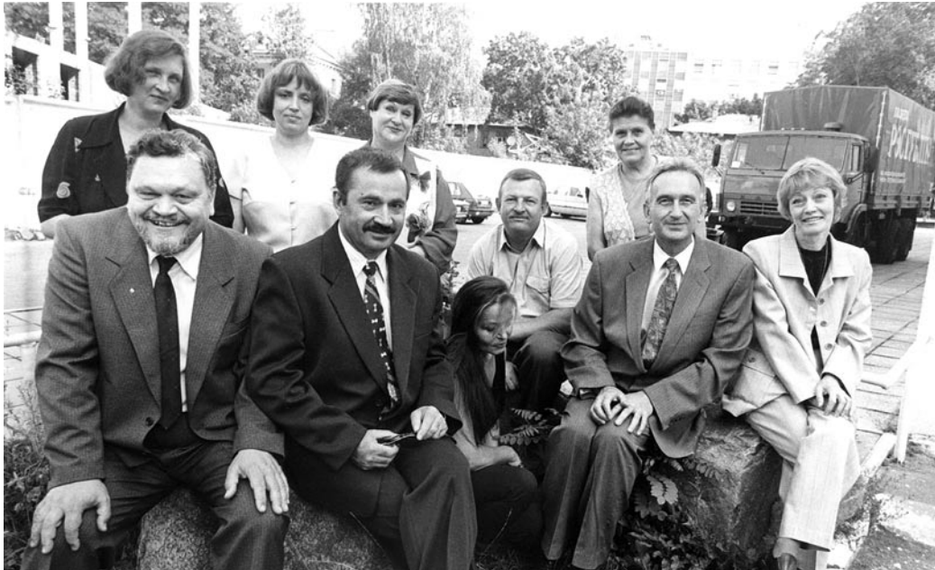
◀ Калектыў рэдакцыі. Пачатак 2000-х

пасаду інструктара арганізацыйнага аддзела ЦК КПСС. Праца ў вышэйшым органе партыйнага кіраўніцтва для кандыдата філасофскіх навук была крыху не па профілі, але Вялічка са сваімі абавязкамі спраўляўся і нараканняў не меў. І ўсё ж яго нястрымна цягнула ў родную Беларусь. Таму, як толькі з'явілася магчымасць, ён вярнуўся ў Мінск і ў хуткім часе быў прызначаны на пасаду галоўнага рэдактара часопіса «Коммунист Белоруссии».