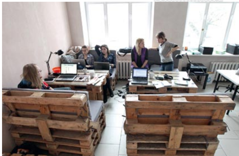
▲ Молодежная социальная служба

Для проведения информационной работы в Глобальной сети Мингорисполкомом создан профайл и группа в социальной платформе Facebook, аккаунт в сервисе микро-