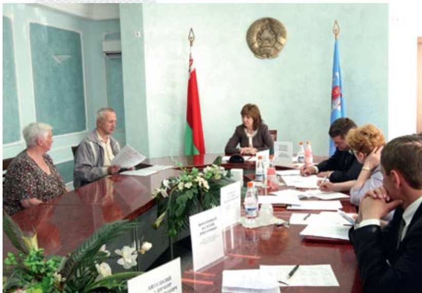
▲ Заместитель премьер-министра Республики Беларусь Наталья Кочанова 26 мая провела выездной прием граждан и юридических лиц в администрации Ленинского района Минска. 2015 год

стема индикаторов, характеризующих динамику и остроту идеологического противоборства в виртуальном пространстве. С результатами исследования участники секции, посвященной проблемам развития современных коммуникаций, знакомятся более подробно.