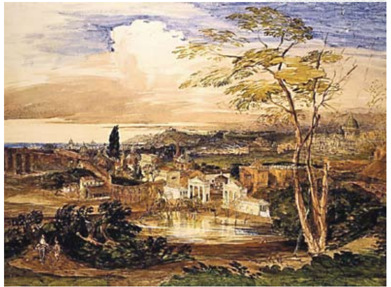
▲ Вид на Рим со стороны садов Боргезе. 1837 год

Можем ли предположить, что это она, уникальная энергия каждого конкретного будоражающего воздействия, вкупе с особенностями «затворяющегося» ландшафта, создает то неуловимое, что шестым чувством фиксируется нами как неповторимый характер, атмосфера того или иного города? Можем ли предположить, что тот или иной