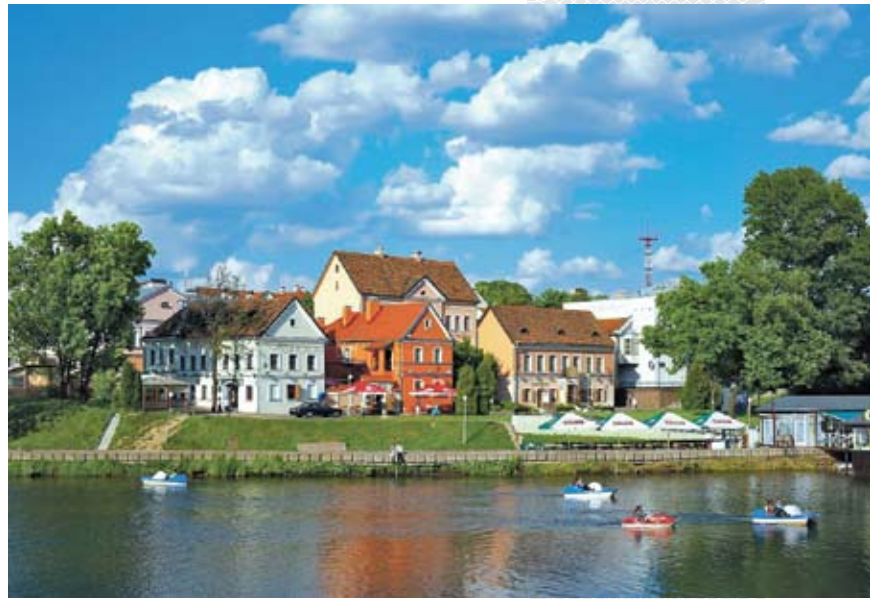
▲ Минск. Троицкое предместье

Что такое «свой» город? Ментальная суть его более или менее аутентична нашему состоянию и настроению – не сиюминут-