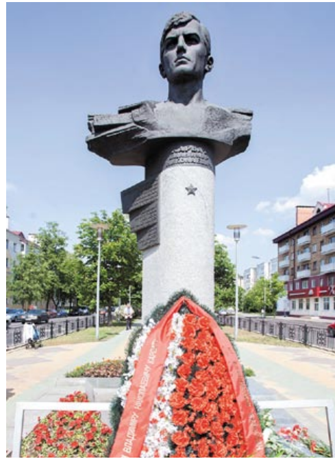
◀ Помнік Герою Беларусі Уладзіміру Карвату ў Брэсце

У 61-й знішчальнай авіяцыйнай базе ўжо шмат гадоў працуе Музей баявой славы імя Героя Беларусі Уладзіміра Карвата. Яго экспазіцыя адлюстроўвае гісторыю і слаўны баявы шлях гэтага вайсковага