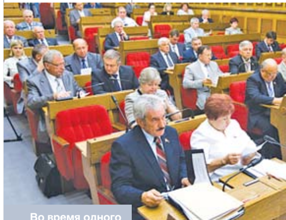
Во время одного из заседаний четвертой сессии Совета Республики Национального собрания Республики Беларусь

Этот документ должен учитываться при разработке и реализации схемы рационального размещения особо охраняемых природных территорий республиканского