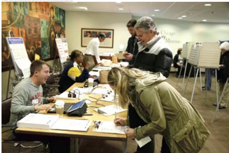
▲ На избирательном участке в США. 2016 год

циональных меньшинств, люди с низкими доходами, за республиканцев – состоятельная часть населения, а также средний класс. Поэтому партии создают группы, которые внимательно проверяют базы избирателей. После чего направляют властям жалобы с просьбами удалить из списков отобранных ими людей, аргументируя это формальными поводами. Накануне президентских выборов 2000 года республиканцам удалось таким образом только в штате Флорида вычеркнуть из списков свыше 50 000 избирателей.