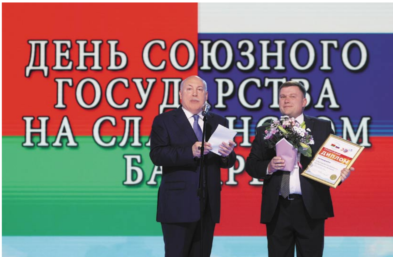
На концерте в День Союзного государства творческим коллективам и артистам России и Беларуси Государственный секретарь Союзного государства Дмитрий Мезенцев вручил дипломы Постоянного Комитета Союзного государства. На снимке: награду получил главный дирижер Президентского оркестра Республики Беларусь Виталий Кульбаков

представлено! Шкатулки, подсвечники, светильники, вазы, посуда, ложки, иконы – всего 500 различных оригинальных изделий с уникальной хохломской росписью. В работе нижегородские мастера используют липу, специально приготовленное льняное масло и натуральные красители – киноварь, охру, сажу. Так что их продукция не только невероятно красива, но и экологична, что немаловажно.