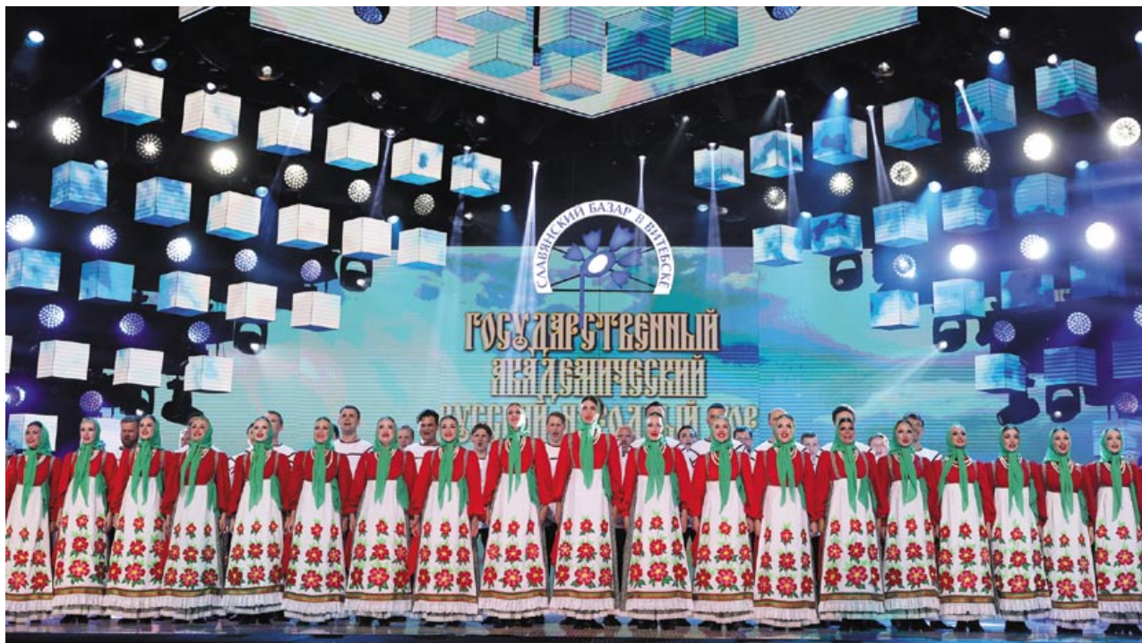
На сцене «Славянского базара» – Государственный академический русский народный хор имени М.Е. Пятницкого

В День Союзного государства состоялось и открытие единственной в своем роде выставки народных промыслов «Золотая хохлома – душа России» в Витебском художественном музее. Чего здесь только не было