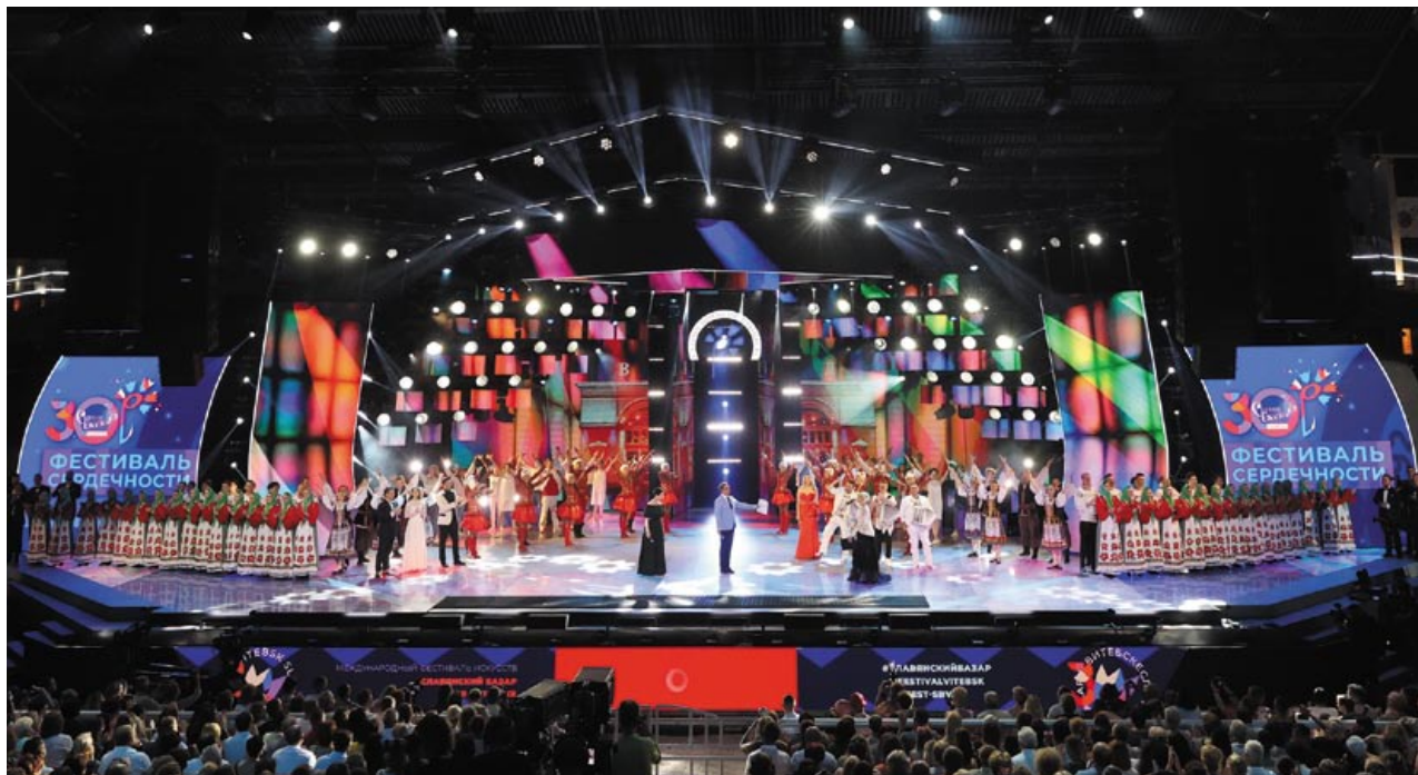
На концерте в День Союзного государства на «Славянском базаре в Витебске»

друг Беларуси – всегда являетесь желанным гостем на нашей земле».