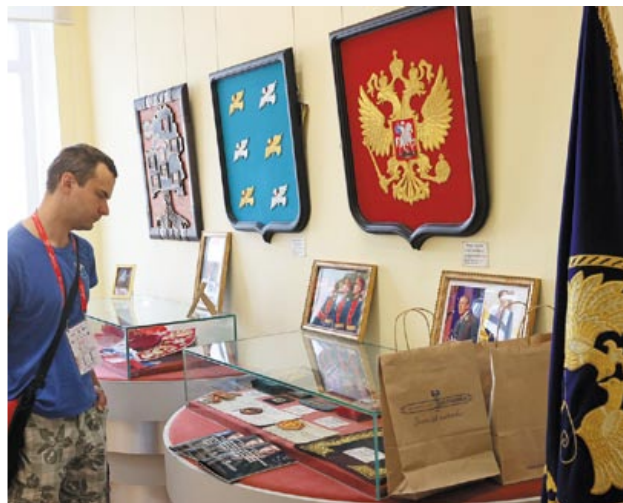
В День Союзного государства в Витебске открылись две выставки – «Золотая хохлома – душа России» и «Торжок – живая традиция золотого шитья»