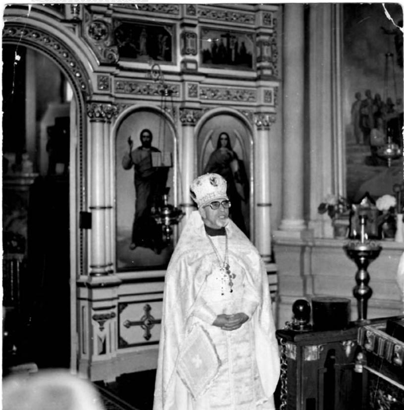
▲ В храме перед алтарем. 1980-е годы