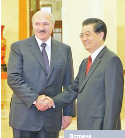
Встреча Президента Беларуси Александра Лукашенко и Председателя КНР Ху Цзиньтао. Пекин, 11 октября 2010 года

Рассмотрим пример балтийских соседей Беларуси. Средняя по размеру экономики Латвия входила в глобальный кризис с приватизированными государственными активами и внешним долгом в 42 млрд. долларов на 2,3 млн. человек населения. Белорусский долг в 14,5 млрд. долларов на момент начала кризиса на 9,6 млн. населения оказался в 12 раз меньше, если рассчитывать на одного человека. Ситуация с внешним долгом в Литве лишь немногим лучше латвийской. Если дальше сравнивать экономики Беларуси и Латвии, то необходимо упомянуть и о результатах кризиса. По прогнозам МВФ на 2010 год, ВВП Латвии, рассчитанный по паритету покупательной способности на душу населения, будет превосходить белорусский лишь на 5,3 %, двумя годами ранее разница