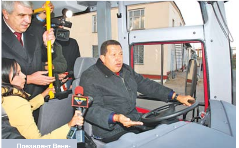
Президент Венесуэлы Уго Чавес во время посещения ОАО «МАЗ». Минск, октябрь 2010 года

Кроме того, здесь следует учитывать влияние весьма важного глобального тренда. Многие страны ЕС вслед за США