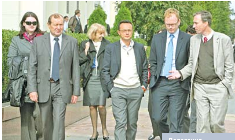
Делегация Всемирного банка во время посещения свободной экономической зоны «Брест». Сентябрь 2010 года

Трудно согласиться с тезисом, что Беларусь «обречена на евроинтеграцию». Пока что главные достижения многих