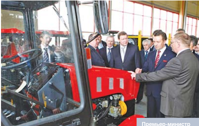
Премьер-министр Беларуси Сергей Сидорский осматривает сборочное производство тракторов «Беларус» в Елабуге (Россия)

Перспективы технологического потенциала Китая специалистам видны по стремительному росту количества зарегистрированных жителями этой страны патентов и индексам цитирования в престижных журналах работ китайских ученых – скоро Китай станет одним из основных поставщиков современных технологий. Таким образом, возникает перспектива, при которой Беларусь окажется первой страной Европы, угадавшей еще с середины 1990-х новый тренд на смену глобального лидерства.