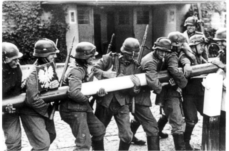
▲ Немецкие войска переходят границу с Польшей. 1 сентября 1939 года

Современные польские политики нередко представляют события сентября 1939 года как результат сговора двух агрессоров: фашистской Германии и СССР, которые напали на невинную жертву – Польшу. О том, что эта «жертва» сама строила агрессивные планы в отношении стран-соседей и участвовала в захвате их территорий, стараются не упоминать.