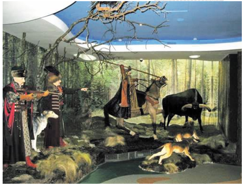
▲ Фрагмент экспазіцыі Музея прыроды Нацыянальнага парку «Белавежская пушча»

Інстытут гісторыі імкнецца развіваць супрацоўніцтва з замежнымі партнёрамі.