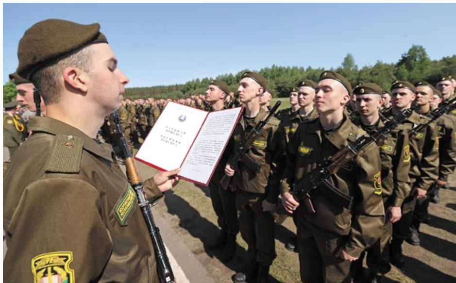
Присяга на верность Родине. Май 2023 года

склонны тянуться за авторитетом, и такая просветительская работа – с реальными людьми и на конкретных примерах – достаточно эффективна.