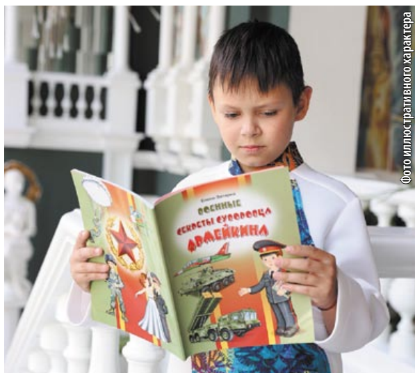
Фото иллюстративного характера

Несколько лет возглавляю жюри фестиваля «Голоса границы». В нем всегда участвуют и семьи пограничников, организаторы вообще стараются привлечь как можно больше людей со стороны. И я совершенно четко представляю, что фестиваль имеет важное значение для имиджа нашей армии, не только пограничной службы. Сейчас формирование образа солдата, защитника Родины, – очень важная часть идеологической политики. И этот процесс ни в коем случае нельзя пускать на самотек.