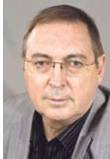
ВЫДРИН Дмитрий Игнатьевич – политолог, философ, публицист, советник 4 президентов Украины, народный депутат Верховной Рады Украины 5-го созыва (Киев)

ЗАТУЛИН К.Ф.: Давайте сравним некоторые показатели. В России всего 7 % российской