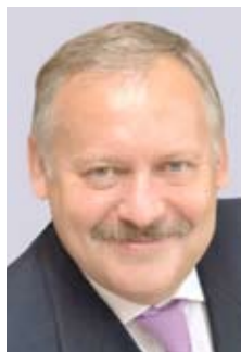
ЗАТУЛИН Константин Федорович – политолог, директор Института стран СНГ, депутат Государственной Думы Российской Федерации 1-го, 4-го, 5-го созывов (Москва)

ЗАТУЛИН К.Ф.: Ситуация, в которой оказался Советский Союз в конце 1980-х – начале 1990-х, известна. Дальше, как вы знаете, начались попытки каким-то образом примирить желаемое и действительное. Когда подписывались Беловежские соглашения, руководители Беларуси, Украины и России были озабочены тем, в какую форму вообще облечь факт роспуска Советского Союза. Много позже Леонид Макарович Кравчук мне говорил, а потом и написал в своих воспоминаниях достаточно откровенно о том, что тогда нельзя было просто так распустить СССР – нужно было сказать людям, что мы создаем нечто новое. Ведь за полгода до этого прошел референдум о сохранении Советского Союза, и большинство проголосовало «за», в том числе и Беларусь с Украиной. Только что слу-