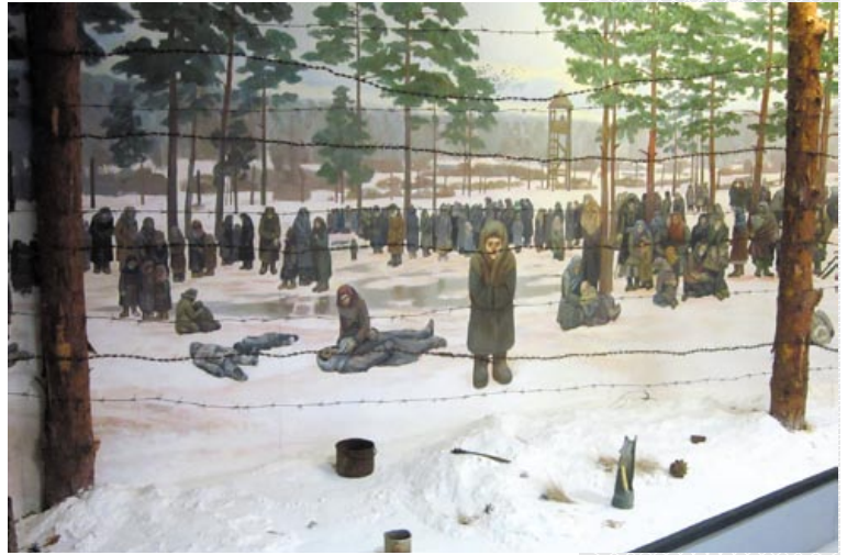
▲ Фрагмент дыярамы ў Музеі памяці ахвяр Азарыцкага лагера смерці

А вось як згадаў пра гэта ў сваёй кнізе «В походах и боях» камандуючы 65-й арміяй генерал-лейтэнант П. Батаў: «На правом фланге противник не предпринимал больше активных действий. Но здесь свирепствовал другой враг –