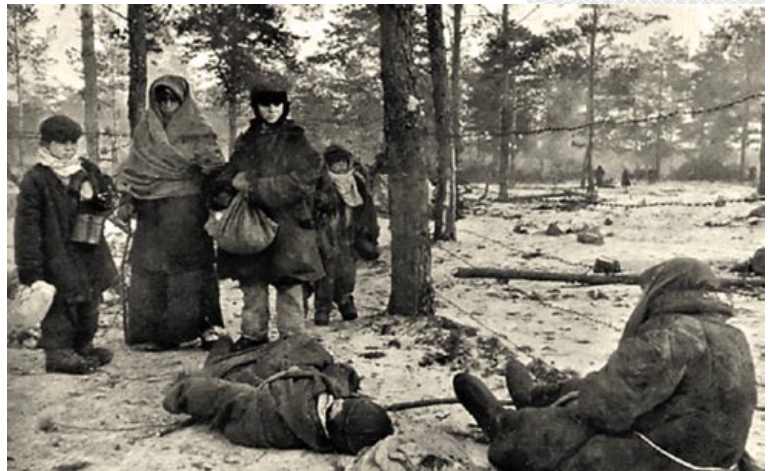
▲ Першыя хвіліны вызвалення вязняў канцлагера «Азарычы». Сакавік 1944 года. Архіўнае фота

І ўсё ж задума ворага па стварэнні на шляху наступаючай Чырвонай арміі жывога шчыта ў поўнай меры не спрацавала. Па гарачых слядах Ваеннай пракуратурай 65-й арміі было праведзена расследаванне злачынстваў, учыненых нацыстамі ў Азарыцкіх лагерах смерці. Яго матэрыялы затым былі перададзены Надзвычайнай дзяржаўнай камісіі па ўстанаўленні і расследаванні злачынстваў нямецка-фашысцкіх захопнікаў і іх памагатых. Яны разглядаліся і на пасяджэнні Міжнароднага ваеннага трыбунала № 1, які праходзіў у Нюрнбергу з 20 лістапада 1945 па 1 кастрычніка 1946 года. Памочнік галоўнага абвінавачаўца ад СССР Л. Смірноў тады заявіў: «Созданием концентрационных лагерей у передне-го края обороны с размещением в них