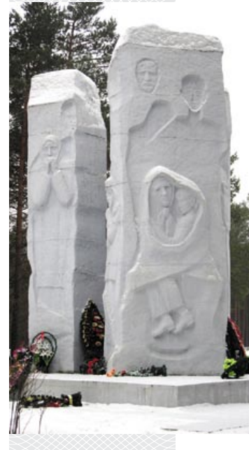
▼ Мемарыял на месцы Азарыцкага лагера смерці