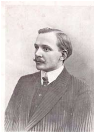
Фотопартрэт Янкі Купалы з яго аўтографам для кнігі «Шляхам жыцця». 1913 год

Я. Купала цвёрда верыў у светлую будучыню роднага краю, адраджэнне нацыі, заможнае жыццё чалавека працы. Аптымізмам напоўнены верш «Зашумеў лес