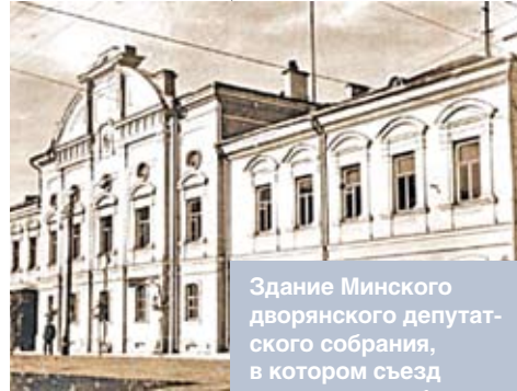
Здание Минского дворянского депутатского собрания, в котором съезд продолжил работу. Здание не сохранилось (ныне угол улиц Маркса и Энгельса)

Правые, т.е. радисты и незалежники, пытались заставить съезд избрать из своего состава орган «краевой власти в лице Всебелорусского Совета крестьянских, рабочих и солдатских депутатов, который временно становится во главе управления краем». Съезд, однако, отказался и от этой части, ясно себе отдавая отчет, что в крае уже существует советская власть.