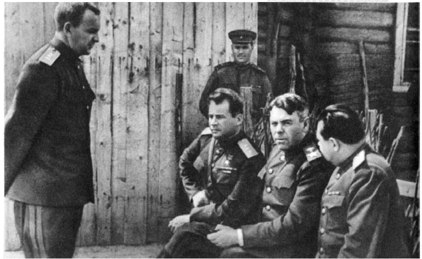
▲ Военачальники Т.Т. Хрюкин, И.Д. Черняховский, А.М. Василевский, В.Е. Макаров на командном пункте 3-го Белорусского фронта (слева направо). Лето 1944 года

А.М. Василевский в годы войны почти постоянно находился на фронтах в роли