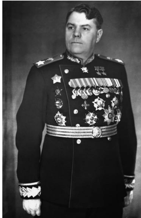
◀ Маршал Советского Союза А.М. Василевский

В ряде публикаций о А.М. Василевском ничего не говорится о его службе в рядах Красной армии в годы Гражданской войны. Попробуем восполнить этот пробел. В апреле 1919 года будущий маршал был призван на службу в РККА Новосильским уездным военкоматом Тульской губернии и направлен в 4-й запасной батальон, который дислоцировался в городе Ефремове. Служба началась в мае 1919 года: он был помощником командира взвода, командиром воинского отряда в количестве 100 человек из состава 4-го запасного батальона, командиром одной из рот 2-й Тульской стрелковой дивизии, командиром 3-го батальона этой дивизии, командиром 5-го стрелкового полка 2-й Тульской стрелковой дивизии, командиром 427-го полка 143-й стрелковой бригады 48-й стрелковой дивизии, помощником командира 96-го полка 32-й бригады 11-й Петроградской стрелковой дивизии, затем – вновь командиром 427-го стрелкового полка 48-й дивизии, помощником командира 429-го стрелкового полка 143-й стрелковой бригады 48-й дивизии 4-й армии, командиром отдельного батальона 48-й дивизии, помощником командира 424-го полка 142-й стрелковой бригады, начальником штаба 142-й бригады.