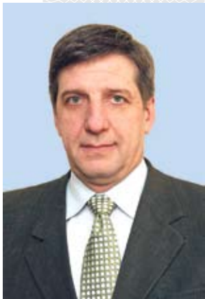
▲ Уладзімір Астапенка, Надзвычайны і Паўнамоцны Пасол Рэспублікі Беларусь у Рэспубліцы Куба

максімуму ў гандлі з ЗША ў 2001 годзе – 138 млн долараў, а ўжо ў наступным годзе гэты паказчык скараціўся да 45 млн, у 2003 – да 33 млн.