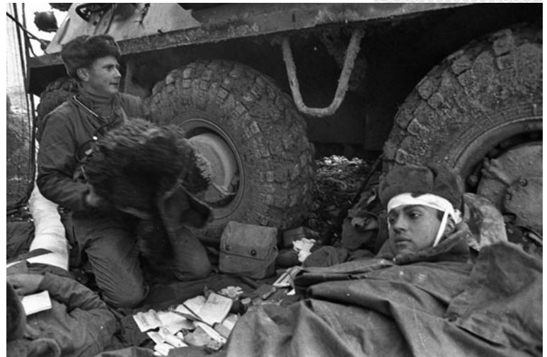
▲ Под защитой бронетранспортера. Скорая медпомощь раненым в бою.

– Черт бы их побрал, этих «духов», такой шикарный сон загубили, – недовольно «прошелся» он по моджахедам. – Дочка