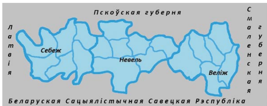
Тэрыторыі трох паўночных паветаў былой Віцебскай губерні, што ў 1924 годзе былі перададзены ў склад Пскоўскай губерні. Малюнак аўтара

Летам 1926 года Дзяржплан БССР накіраваў у ЦВК СССР дакладную запіску аб раянаванні БССР, у якой адзначалася, што «целый ряд основной экономического характера побуждают признать нецелесообразность образования особой Западной области и, напротив, выдвигают вопрос о необходимости доведения границ БССР до их естественных