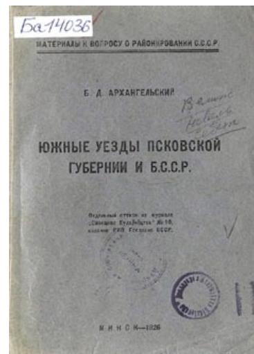
У сваёй працы Б.Д. Архангельскі паказаў эканамічныя сувязі Веліжскага, Невельскага і Себежскага паветаў з былым губерніскім цэнтрам у Віцебску, а таксама перавагу ў іх беларускага насельніцтва

Такім чынам, трыгерам для ўзняцця пытання аб працягу вяртання ўсходнебеларускіх тэрыторый паслужыла жаданне аргбюро Заходняй вобласці РСФСР стварыць аднайменную вобласць, уключыўшы ў яе склад спрадвечна