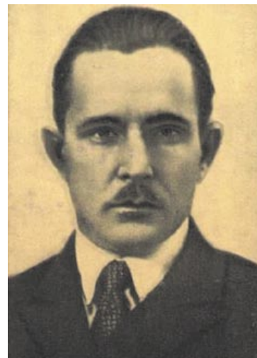
Другі сакратар ЦК КП(б)Б М.М. Галадзеда. 1930-я гады

Прычына таго, што апошняе вяртанне ўсходнебеларускіх тэрыторый так і не адбылося, на думку гісторыка С. Хоміча, які дасканала даследаваў пытанне станаўлення межаў Беларускай дзяржавы, заключалася ў тым, што «в конце 1920-х гг. в СССР произошла ревизия целей и задач ранее проводимой советской национальной политики. И все те соображения, которыми оперировали белорусские власти, перестали быть приоритетными с точки зрения высшего руководства СССР».