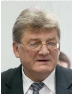
Леонид ЦУПРИК, заместитель председателя Брестского облисполкома