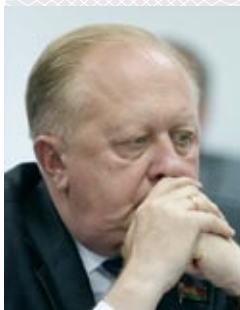
Виктор ЛИСКОВИЧ, заместитель председателя Гродненского облисполкома

рицательное сальдо по области составляло 107,5 млн долларов, то по итогам 2015 мы уже имели положительное сальдо 538,5 млн долларов. Сегодня наш регион привлекателен и перспективен для инвесторов. На рассмотрении в облисполкоме находится десяток новых предложений от бизнесменов ближнего и дальнего зарубежья.