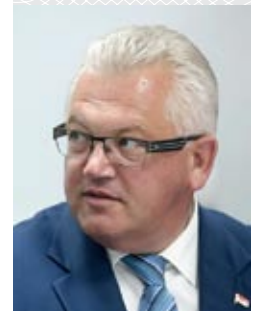
Игорь КАРПЕНКО, заместитель председателя Минского горисполкома