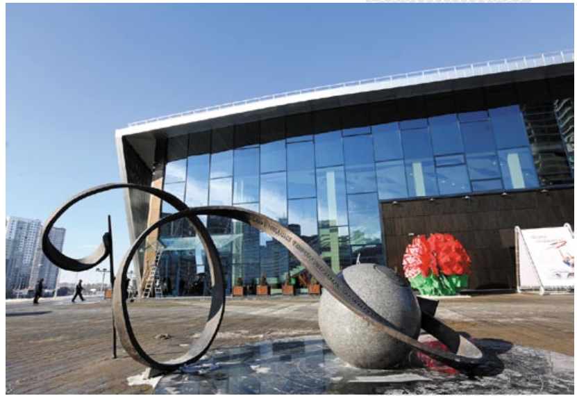
▲ Республиканский центр олимпийской подготовки по художественной гимнастике. Март 2018 года

Самым продолжительным по времени было для участников экспертно-медийного тура посещение многофункционального культурно-спортивного комплекса «Минск-Арена». И это естественно: чтобы рассмотреть саму «Минск-Арену» (15 тыс. мест), велодром (2 тыс.), конькобежный стадион (3 тыс.), нужен не один час. Комплекс во время Игр будет принимать соревнования по спортивной и художественной гимнастике, акробатике, аэробике, прыжкам на батуте и велоспорту на треке.