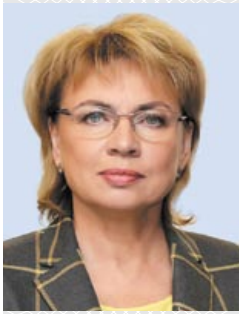
Марианна ЩЁТКИНА, заместитель председателя Совета Республики Национального собрания Республики Беларусь, председатель Белорусского союза женщин

Гендерное равенство играет ключевую роль в обеспечении мира, процветания и устойчивого развития, служит важным элементом социальной справедливости. В Декларации «Преобразование нашего мира: Повестка дня в области устойчивого развития на период до 2030 года», принятой резолюцией Генассамблеи ООН в 2015 году, предусматривается обеспечение к 2030 году всестороннего и эффективного участия женщин в принятии решений в политической, экономической, общественной сферах.