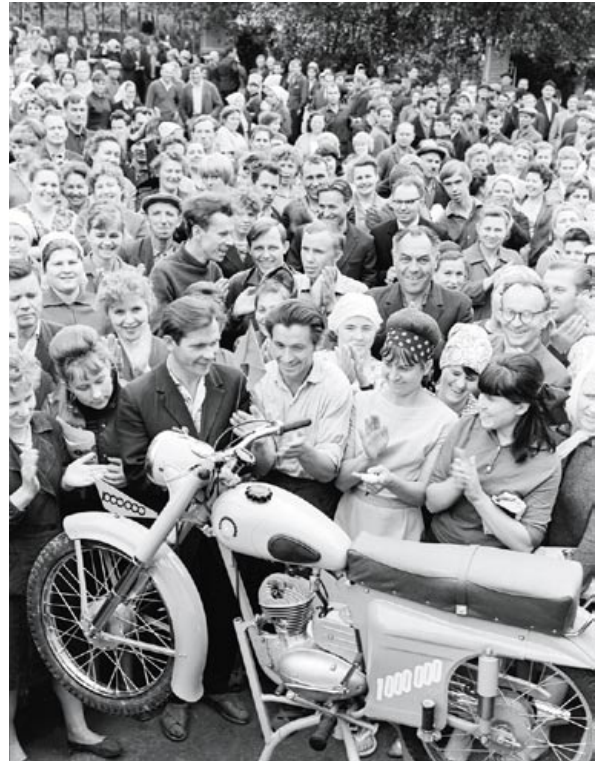
Ёсць мільёны матацыкл! Мітынг на Мінскім матацыклтна-веласіпедным заводзе. 1967 год

Усё гэта накладвала адбітак на вынікі развіцця як беларускай, так і ўсёй савецкай прамысловасці ў 1971–1985 гадах, калі ў СССР і БССР выконваліся дзявяты (1971–1975), дзясяты (1976–1980) і адзінаццаты (1981–1985) народнагаспадарчыя планы. З аднаго боку, прамысловасць БССР, як і ўся прамысловасць СССР, абапіраючыся на дасягнуты патэнцыял, прадоўжыла ў цэлым паспяхова рухацца наперад. У 1985 годзе прадукцыя прамысловасці рэспублікі павялічылася ў параўнанні з 1970 годам у 3,02 раза [15, с. 22; 16, с. 39].