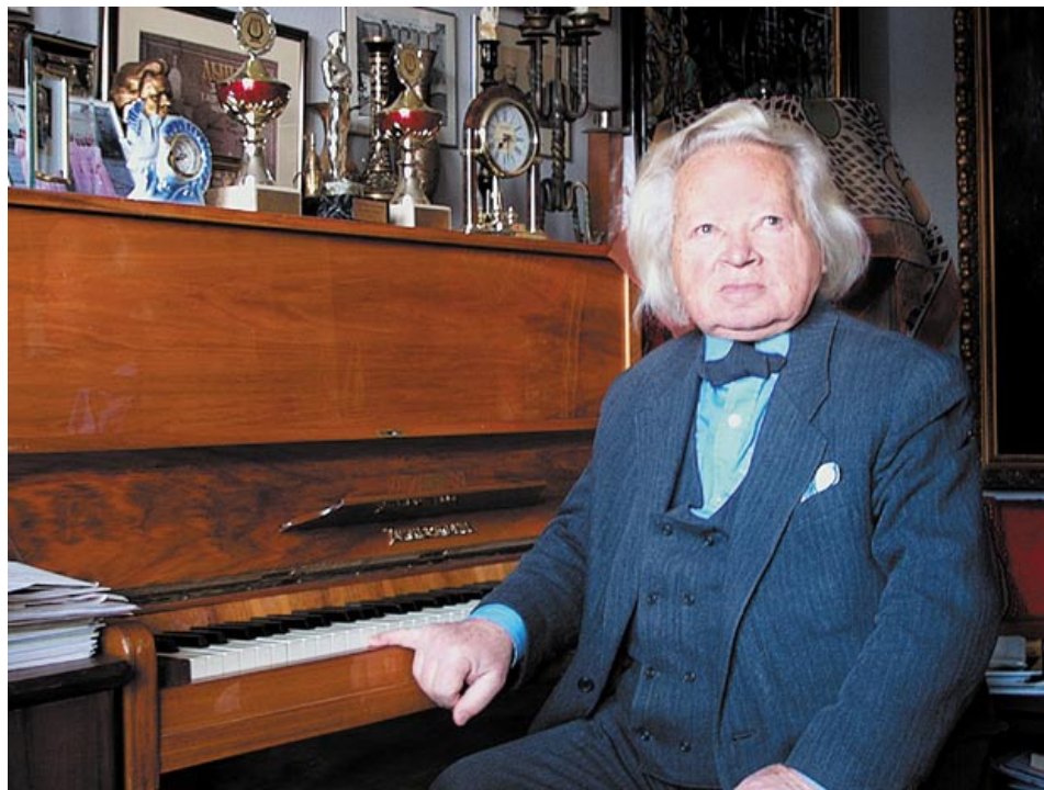
Маэстро Виктор Ровдо. 2004 год

Но точно знал, что не каждому. Совсем-совсем не каждому. И, кстати, Солохин был единственным художником, кому он согласился позировать, хотя в ту пору выдающихся и народных было много.