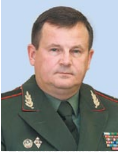
Андрей РАВКОВ, министр обороны Республики Беларусь, генерал-лейтенант

Белорусская стратегическая операция «Багратион» — одна из крупнейших стратегических наступательных операций Красной армии в годы Великой Отечественной войны и одна из крупнейших военных операций за всю историю войн. Проведенная с 23 июня по 29 июля 1944 года, она имела целью разгром группы армий «Центр» и освобождение Белорусской ССР. И эта цель была достигнута полностью. Наши войска вышли на государственную границу СССР. Впереди было освобождение всей Европы.