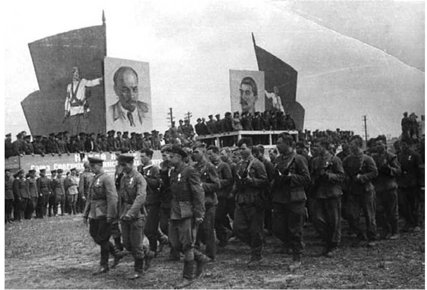
▲ Партизанский парад в Минске 16 июля 1944 года

16 июля 1944 года, за день до «парада побежденных» в Москве, состоялся еще один, особо знаменитый, – парад белорусских партизан в Минске. Это