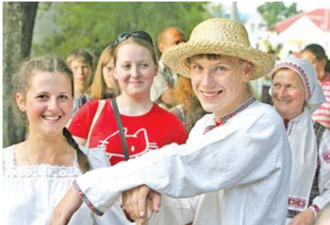
Участники фестиваля фольклорного искусства «Берагіня»

наличие независимого государства предстает в массовом сознании как нечто естественное и гарантированное, а не как благо, которое необходимо отстаивать. Независимая и суверенная Республика Беларусь видится большинству ее граждан как контур, очерченный границами на карте и закреплённый государственной символикой, то есть вне связи с внутри- и внешнеполитической, экономической, правовой, социальной конкретикой. Этот антипрагматизм белорусской национальной идентичности дополняется антиромантизмом. Последний проявляется в отношении к третьему по степени значимости аспекту национальной идентичности – идентификации с национальной культурой.