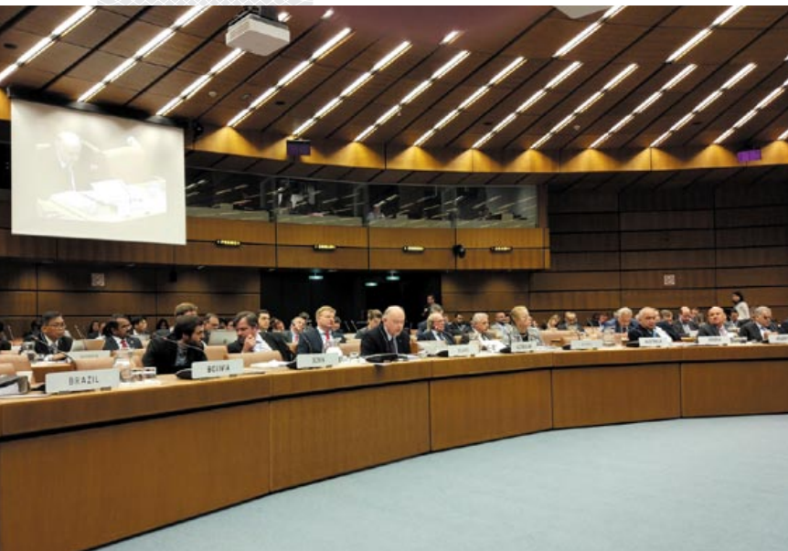
▲ Заявление делегации Республики Беларусь на заседании Комитета ООН по исследованию и использованию космического пространства в мирных целях. Вена, 6 июля 2017 года