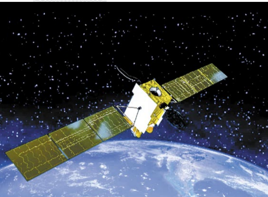
▲ Спутник «Белинтерсат-1». 2016 год

веденный на орбиту 22 июля 2012 года, и Белорусская космическая система дистанционного зондирования Земли (БКСДЗ). В составе последней – центр управления полетом и станция приема и обработки космической информации, а также командно-измерительный пункт. Благодаря деятельности наших и российских специалистов, период эксплуатации БКА продлен до конца 2021 года, т. е. увеличен практически в два раза по сравнению с начальным сроком.