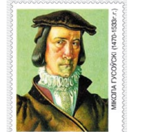
БЕЛАРУСЬ BELARUS 1996 3000