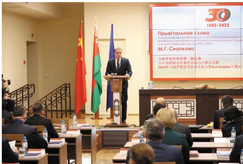
12 января 2022 года в Минске в Республиканском институте китаеведения имени Конфуция БГУ прошла Международная научно-практическая конференция «Три десятилетия белорусско-китайских отношений и создание сообщества единой судьбы человечества»

нистерств образования двух стран [8]. Наиболее активное сотрудничество происходит на межвузовском уровне: действует более 400 белорусско-китайских договоров, реализуется ряд совместных программ обучения, функционируют две совместные научные лаборатории в Минске и Гомеле, осуществляется прямой академический обмен студентами и специалистами, а перечень совместных программ подготовки постоянно расширяется [9].