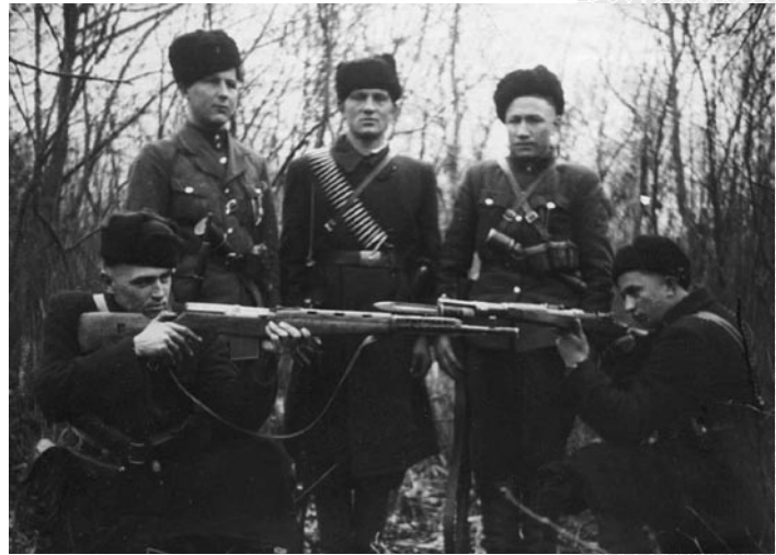
▲ Участники ОУН–УПА

В будущем государстве декларировались свободный труд, свободный выбор профессии и свободный выбор места труда, равенство в правах и обязанностях мужчин и женщин. Программа провозглашала введение пенсионного обеспечения для всех работающих. Медицинское обслуживание объявлялось бесплатным и доступным для всех. Декларировалась свобода печати, слова, мысли, убеждений, веры и миро-