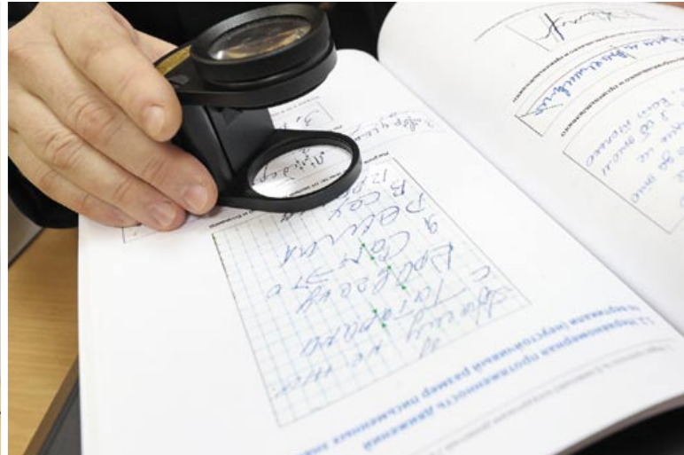
Целых 43 характерных признака укажут на гендерную принадлежность текста

процесс экспертного определения гендерной принадлежности, отметим лишь, что пол автора текста в прямом смысле высчитывают математически-статистическим методом, используя определенные формулы и методики. И тем не менее не так уж редко случаются ситуации, когда допускается процент вероятности. В таких случаях эксперт в своем заключении укажет, к примеру: более 80 %, что текст выполнен женщиной.