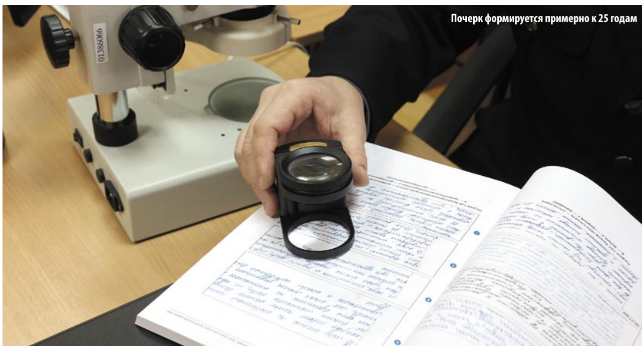
Почерк формируется примерно к 25 годам

Почерковедческая экспертиза для непосвященных может напоминать... сеанс ясновидения. Судите сами: криминалист, не видя человека, чей почерк ему необходимо проанализировать, создает его психологический портрет и тем самым дает