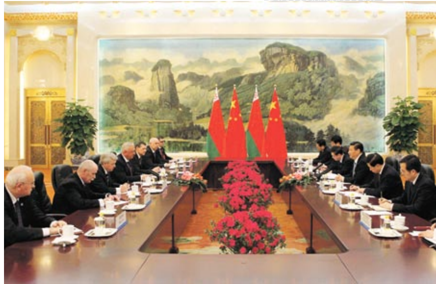
▲ Премьер-министр Беларуси Михаил Мясникович во время встречи с председателем КНР Си Цзиньпином. Китай, 2014 год

Я рад отметить, что всестороннее стратегическое партнерство между КНР и Республикой Беларусь динамично и устойчиво развивается. Особенно за последние два года постоянно повышается уровень контактов и визитов двух стран на высшем уровне, непрерывно углубляется политическое взаимодоверие. Наши двусторонние отношения характеризуются совсем новым наполнением всестороннего, многопрофильного и многопланового сотрудничества. По статистике белорусской стороны, товарооборот между нашими странами за 2013 год достиг 3,29 млрд долларов США, рост по сравнению с 2012 годом составил 17,41 %. Это было особенно нелегко на фоне стагнации мировой экономики. Реализовали ряд проектов, охватывающих такие сферы, как гостиничные комплексы, дорожное строительство, коммуникации, энергетика, химическая промышленность, автомобилестроение, выпуск бытовой техники и т.д. Немало из этих проектов уже завершились