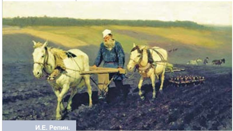
И.Е. Репин. «Пахарь (Л.Н.Толстой на пашне)». 1887 год