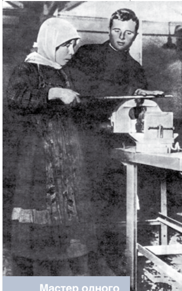
Мастер одного из московских заводов обучает слесарному делу крестьянскую девушку. Начало 1930-х годов

сализм, незаметно для самого себя теряет нечто очень значительное, возможно, самое важное в своей человеческой сущности. Ту разносторонность не только физического, но и умственного (не интеллектуального, а именно умственного) развития, которую получал здоровый крестьянин, не дает, каким бы странным это ни показалось на первый взгляд, ни один вид современного труда. Но ведь односторонность, «частичность» ведут к деградации человека, к бесконечному его