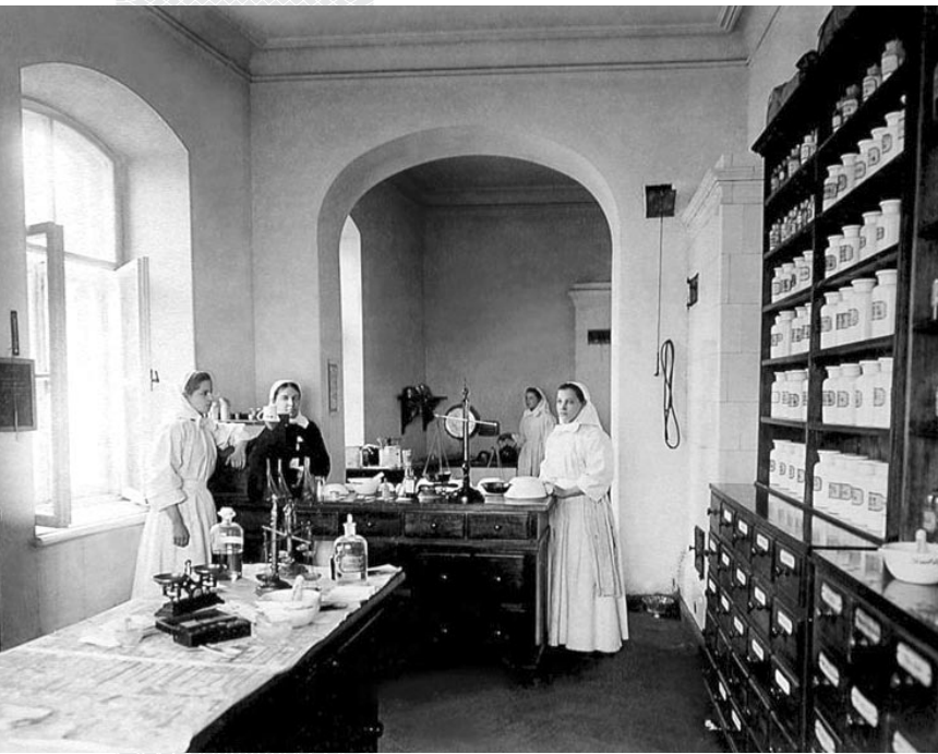
▲ Аптека Александринской общины сестер милосердия. Могилев, 1910-е годы

должали готовить и на местах: в 1914 году в Могилеве началось объединение фельдшерской и повивальной школ. В новом учебном заведении могли учиться как женщины, так и мужчины. Правда, процесс растянулся на три года. И лишь к 1918 году в городе организовалась Центральная фельдшерско-акушерская школа.