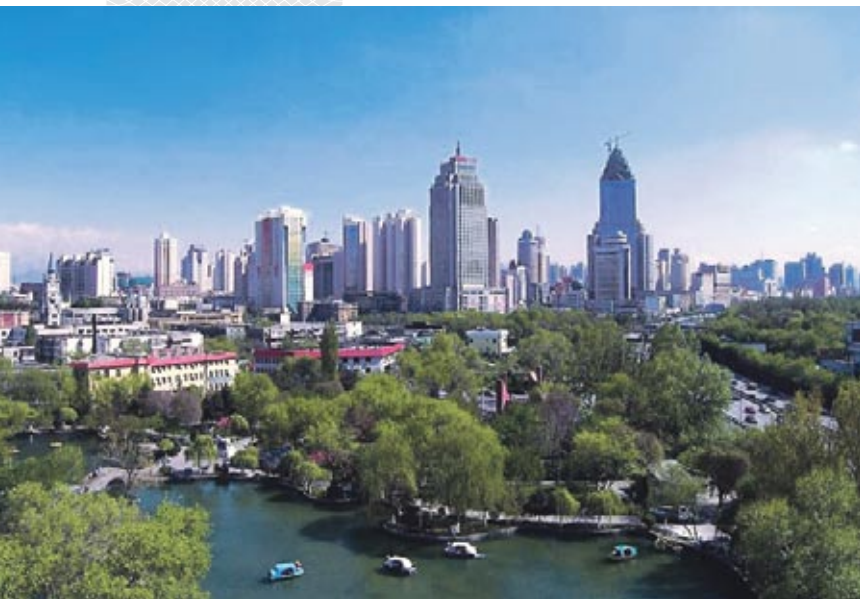
▲ Вид на Урумчи