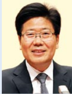
Чжан ЧУНЬСЯНЬ, секретарь парткома Синьцзян-Уйгурского автономного района, член Политбюро ЦК КПК:

– Синьцзян – богатая и щедрая земля. Здесь имеются серьезные природные ресурсы. Запасы нефти составляют 30 %, а газа – 34 % от обще-китайских. Кроме того, активно разрабатываются имеющиеся большие залежи угля. Традиционно развиты садоводство и хлопководство. На территории района находятся хорошие пастбища. Ведь даже название административного центра Урумчи означает «прекрасное пастбище».