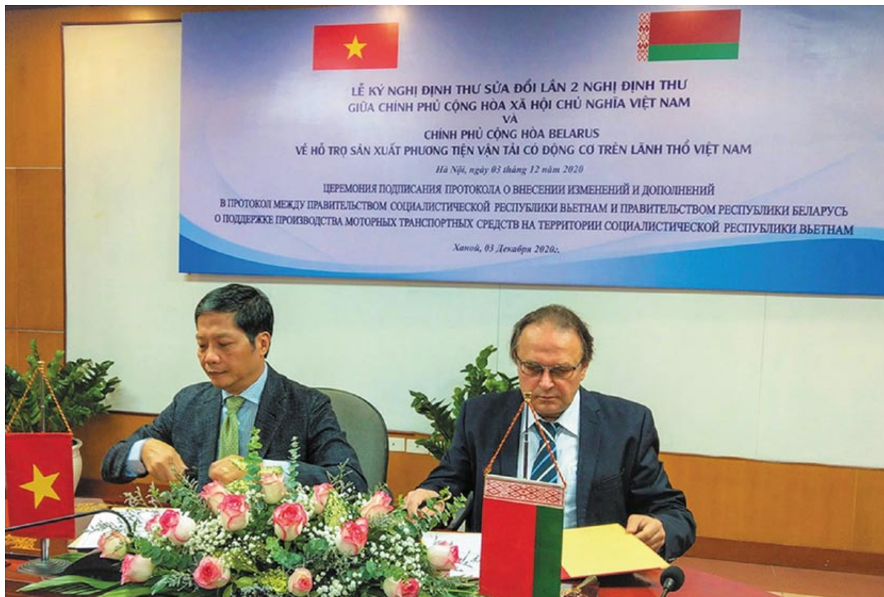
Во время подписания Протокола о внесении изменений и дополнений в Протокол между Правительством Республики Беларусь и Правительством Социалистической Республики Вьетнам о поддержке производства моторных транспортных средств на территории Вьетнама, г. Ханой. 3 декабря 2020 года

На стадии рассмотрения в индонезийском правительстве находится проект по созданию холдинга из предприятий горнодобывающей промышленности. Помимо этого, интерес к использованию карьерных самосвалов «БЕЛАЗ» проявляют крупные инжиниринговые компании, которые реализуют масштабные инфраструктурные проекты по строительству электростанций и дорог.